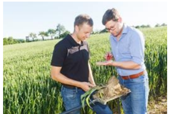
Abbildung 4: Durch die Spatenprobe können Strukturprobleme und Verdichtungen festgestellt werden.

Neben dem Spaten können mit einer Bodensonde etwaige Bodenverdichtungen festgestellt werden. Diese können nach der Ernte bei trockener Witterung mit einem entsprechenden Bodenbearbeitungsschritt aufgelockert werden.