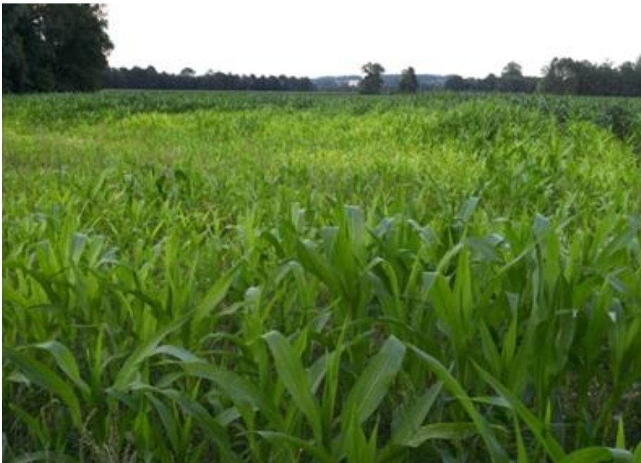
Abbildung 14: Für eine optimale Bestandsentwicklung müssen die benötigten Nährstoffe in ausreichender Form verfügbar sein und die Bodenstruktur darf keine Schwächen vorweisen.

Eine Bodenuntersuchung liefert vielfältige und wertvolle Informationen zum gegenwärtigen Zustand eines Bodens. Auch die Produktivität und die Bodenfruchtbarkeit können durch richtige Interpretation der Ergebnisse abgeleitet werden. Dabei gilt es steht's den Kontext zum jeweiligen Standort herzustellen. Durch Wiederholung der Beprobung alle 4-6 Jahre können Veränderungen im Boden festgestellt werden um letztendlich die richtigen Maßnahmen zur Steigerung der Bodenfruchtbarkeit umzusetzen. Dabei sollte man sich Ziele formulieren und Prioritäten definieren um gezielte Maßnahmen Schritt für Schritt umzusetzen.