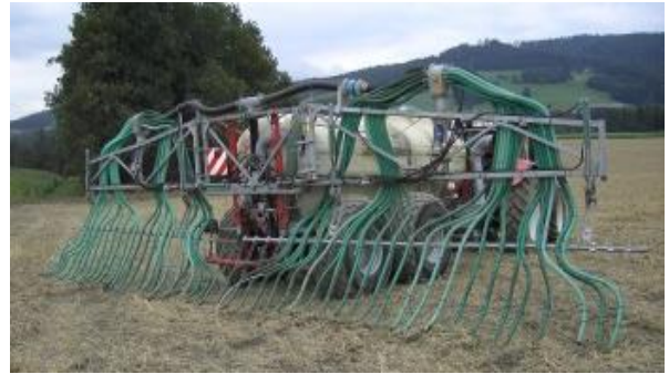
Abbildung 11: Eine bodennahe Ausbringtechnik flüssiger Wirtschaftsdünger reduziert Emissionen und bringt verbesserte Nährstoffeffizienz!

Bei Trockenheit – besonders im Frühjahr – kann die P-Verfügbarkeit vermindert sein. Ein optimaler Luft- und Wasserhaushalt (gute Struktur, Durchwurzelung, Krümel) verbessert die Verfügbarkeit des Phosphors. Ebenso begünstigen höhere Bodentemperaturen und pH-Werte im Bereich zwischen 6 und 7 die Verfügbarkeit des Phosphors.