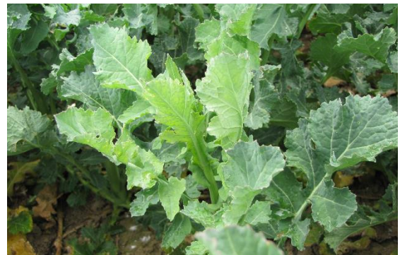
Abbildung 13: Schwefelmangel bei Raps – aufhellen jüngerer Blätter

Schwefel kann in der Pflanze nicht umgelagert werden. Bei einer ausreichenden Versorgung bzw. Überversorgung in älteren Pflanzenteilen kann es zu Schwefelmangel an jungen Teilen kommen (siehe Abb. 13).