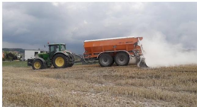
Abbildung 7: Kalk bringt´s!

Auf leichten Böden sind Mengen über 1,5 t CaO pro Hektar, auf mittelschweren und schweren Böden Mengen über 2 t CaO pro Hektar auf mehrere Gaben jeweils im Abstand von zwei Jahren aufzuteilen. Auf schweren, verdichteten Böden haben Branntkalk und Mischkalk eine günstigere und raschere Wirkung als die übrigen Kalkformen. Durch sehr hohe Gehalte an Magnesium kann es zu erhöhten pH-Werten kommen, trotz Mangel an Calcium. Bei derartigen Standorten sollten die austauschbaren Kationen und die Kationen-Austauschkapazität (KAK) untersucht werden. Der Kalkbedarf ist auch immer in Verbindung mit Magnesium (Mg) zu sehen.