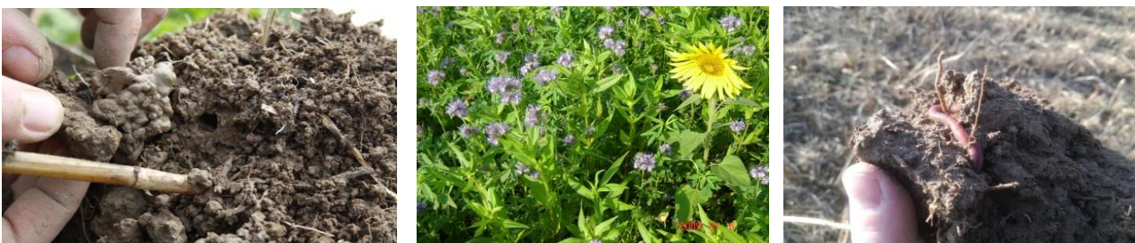
Abbildung 9: Bodenlebewesen, wie der Regenwurm, tragen entscheidend durch ihre Lockerungsaktivitäten und Ausscheidungen zur Humusbildung bei. Sie müssen über Ernterückstände, organische Dünger und Zwischenfrüchte ernährt werden.