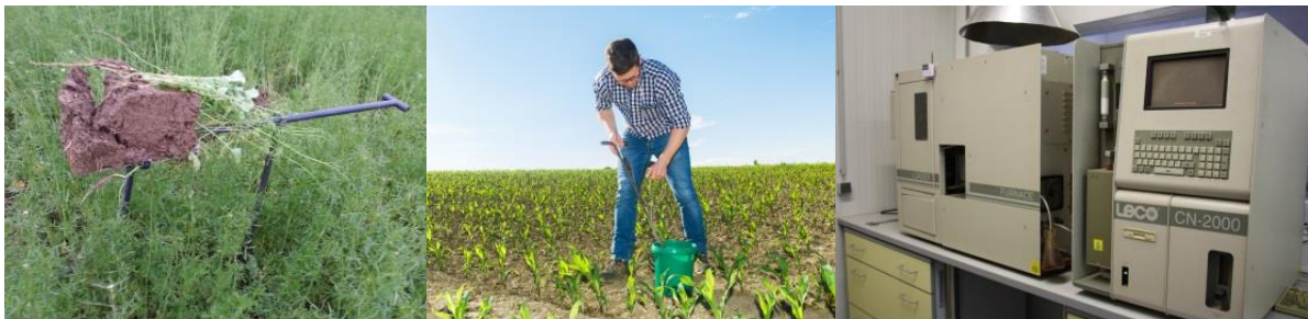
Abbildung 2: Bodenuntersuchungen können direkt am Feld oder mittels Laboranalyse durchgeführt werden.