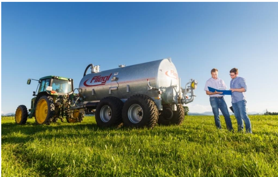
Abbildung 3: Eine bedarfsgerechte Düngung nach Bestandesentwicklung und Einbeziehung der Vorfrucht und Bodengegebenheiten spart Geld und beugt Nährstoffeinträgen in Oberflächen- und Grundwasser vor.