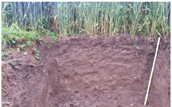
Abbildung 12: Bodenprofil – ein Blick in den Boden lohnt sich allemal!

Bestimmte tonhaltige Böden können Kalium in den Zwischenschichten einlagern, somit der Pflanzenwurzel das Kalium versperren. Auf derartigen Böden sollte die Kaliumdüngung in Teilgaben, ähnlich der Stickstoffdüngung, durchgeführt werden, um so immer wieder „frisches“ Kalium zuzuführen.