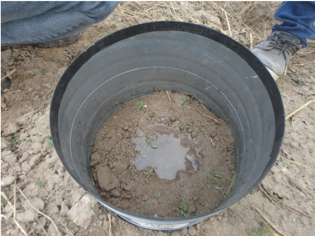
Versickerungstest auf unbewachsenem, bearbeitetem Boden

Wenn die Versickerung auf der bearbeiteten, unbewachsenen Fläche lange dauert, so kann dies auf eine Störung der Vertikaldrainage (z.B. durch Verschmierung von Bodenporen) hinweisen.