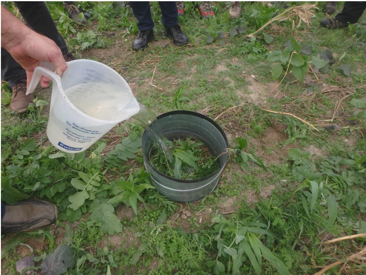
Versickerungstest auf bewachsenem Boden

Auf der bewachsenen Fläche wurde das Wasser ohne zusätzlichen Schutz der Bodenoberfläche hineingeleert. Das Ausschütten von Wasser aus einem Behälter über der Bodenoberfläche stellt sicherlich eine extrem hohe Niederschlagsintensität (hohe Niederschlagsmenge in kurzer Zeit) dar. Die Bodenoberfläche blieb dennoch offen, das Wasser konnte rasch versickern.