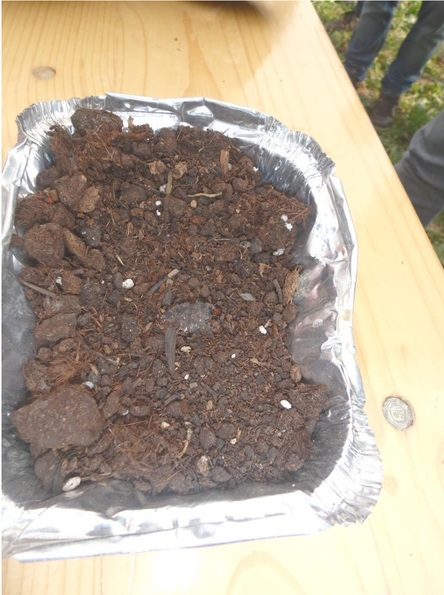
Wassertropfen auf trockenem Material

Ein Grund für eine schlechte Wasseraufnahme kann auch die geringe Benetzungsfähigkeit bei Trockenheit und hohen Bodentemperaturen sein. Dies wurde anhand einer Schale trockener Blumenerde demonstriert, auf der sich beim Befeuchten ein Wassertropfen bildete und nicht versickerte.