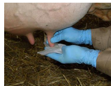
Reinigung der Zitzenkuppen mittels Desinfektionstuch