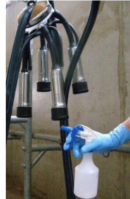
Zwischendesinfektion mit Peressigsäure