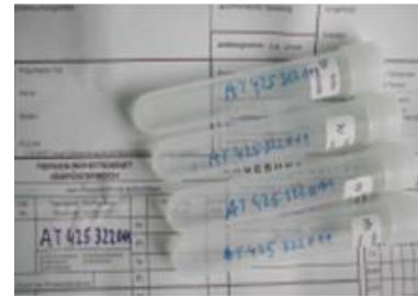
Beschriftung der Röhrrchen