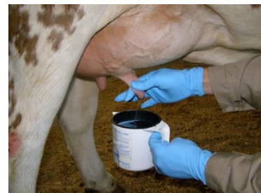
Wegmelken im Vormelkbecher