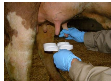
Durchführung eines Schalmtests