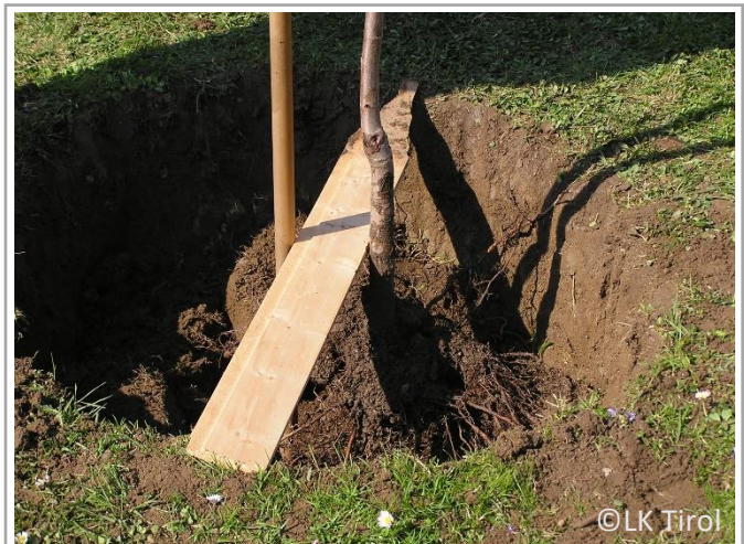
Pflanzloch ausreichend groß ausheben, Pfahl einschlagen und Baum mit etwas Abstand daneben stellen. Anschließend Erde einfüllen, antreten und angießen.

oder abreißen. Feuerbrandbefall in der Nachbarschaft bei der Gemeinde melden. Herbstlaub entfernen und kompostieren. Viele Schadpilze überwintern darauf.